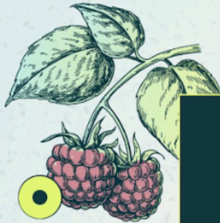
Feuilles de framboisier